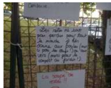
Dispositif « Porteur de paroles » (recueil d'énoncés sur un thème), Ici, sur le gaspillage alimentaire.