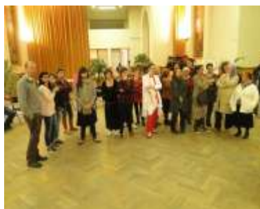
« Tant d'échanges », Débat mouvant, théâtre forum,...autant de façons d'aborder le thème de l'alimentation.