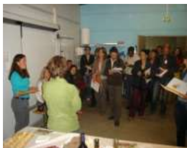
Parcours de visites découvertes d'expériences dans le cadre de l'Université d'été du développement local