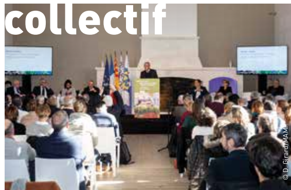
Photo : lancement du Projet alimentaire territorial à Eyguères, en janvier 2019, dans l'exploitation agricole du Gaec Notre-Dame-de-Crau.

Les partenaires et acteurs du PAT se sont régulièrement réunis pour travailler en commun, partager leurs expériences et préciser la feuille de route.