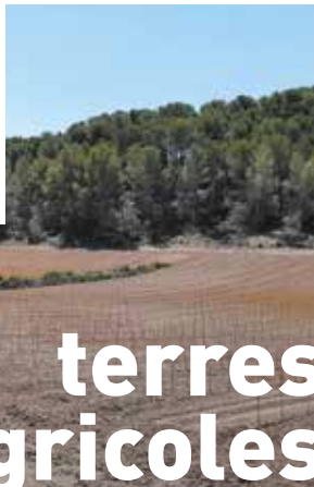
Photo : installation d'un viticulteur sur des terres en friche en bordure de forêt, à Velaux.

dans la mise en place de dispositifs de protection foncière (PAEN—Protection des espaces agricoles et naturels et ZAP—Zone agricole protégée) et de soutien à l'installation d'agriculteurs.